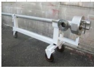
左：AMマシン 中：M1マシン 右：XLマシン