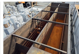
① 内面仕切・加熱コイル