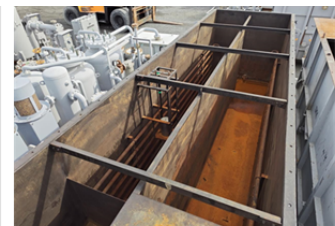
① 内面仕切・加熱コイル