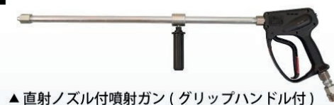
▲直射ノズル付噴射ガン(グリップハンドル付)